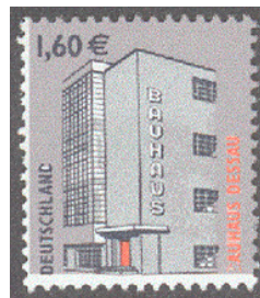
Aufdruck Type IIIba-II wie IIIb, zusätzlich unten freier Rand