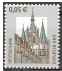
Aufdruck Type IV minimal freie Zählung, mittig freies Rechteck