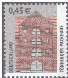
Aufdruck Type IIIca-II wie IIIc, zusätzlich unten freier Rand