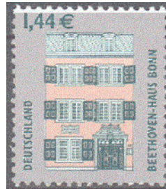
Aufdruck Type IIIaa-I wie III, oben freier Rand