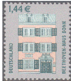
Aufdruck Type III Aufdruck ganzflächig ohne Aussparungen