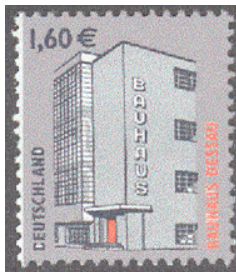
Aufdruck Type IIIb wie III, links freier Rand