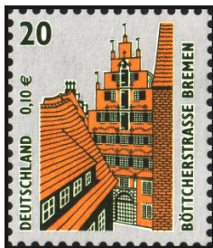
Aufdruck Type II Druck über Zählung; Bildteile, Schrift, Ziffern sind ausgespart