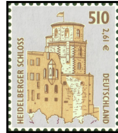
Aufdruck Type I Zählung, Bildteile, Schrift, Ziffern ausgespart

Anzumerken ist, dass der Typ III in mehrere Untertypen einzuteilen ist. Im Normalfall sind die Marken dieses Types ganzflächig mit dem Sicherheitsaufdruck überzogen. Da jedoch die Druckplatte nicht so groß ist wie die Marken, gibt es auf diesen Marken oben, unten, rechts und links unbedruckte Ränder in verschiedenen Größen. In der auf dieser Seite aufgeführten Grafik sind alle Haupt- und Untertypen aufgeführt, die bisher bekannt geworden sind. In meiner anschließenden Liste finden Sie nur die Typen der Euro-Währung und die Sondermarken in Rollen Leuchtturm Roter Sand .