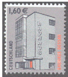
Aufdruck Type IIIba-I wie IIIb, zusätzlich oben freier Rand