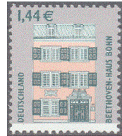
Aufdruck Type IIIaa-II wie III, unten freier Rand