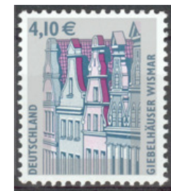
Aufdruck Type V Zählung frei bis ins Markenbild, mittig freies Rechteck

Auf den Seiten 18 bis 22 der Listen EZM und Streifen und auf den Seiten 10 bis 12 der Listen RE und RA finden Sie Streifengummi der Serie Sehenswürdigkeiten mit den verschiedenen Sicherheitsaufdrucken aufgelistet.