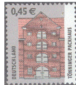
Aufdruck Type IIIc Wie III, rechts freier Rand