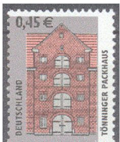
Aufdruck Type IIIca-I wie IIIc, zusätzlich oben freier Rand